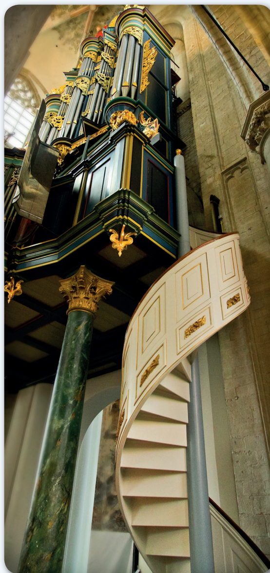
Grote Kerk, Breda (Niederlande)